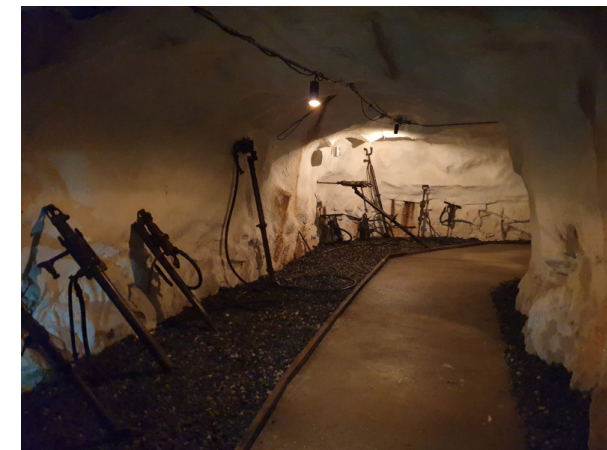
I anslutning till Mojsen ligger en mindre besöksgruva med installationer som visar arbetet i gruvan och gruvarbetarens vardag.

Det ståtliga Maskinhuset var hjärtat för energin till underjordsverksamheten. Här stod maskiner som förde hissarnas linor upp och ner. I Maskinhuset fanns också omformare för elström och kompressorer för tryckluft till borrar och lastmaskiner. Numera används maskinhuset som utställningslokal under sommaren.