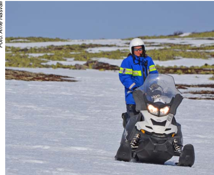
Arbete i skyddad natur får utföras av naturbevakare i tjänsten, även där det är förbud mot snöskoterkörning

Regler finns för att minska risken att snöskotrar skadar mark och växter eller stör djur, friluftsliv och renskötsel. Visa hänsyn till naturen och till varandra!